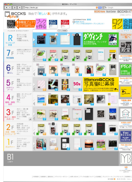
上図) BCCKS HOME（トップページ）【03】